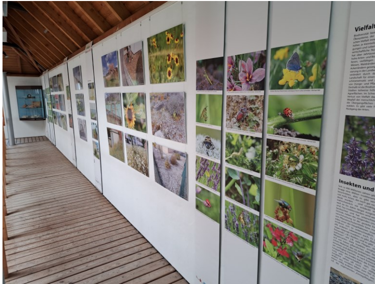
Fotoausstellung Grün oder Grau