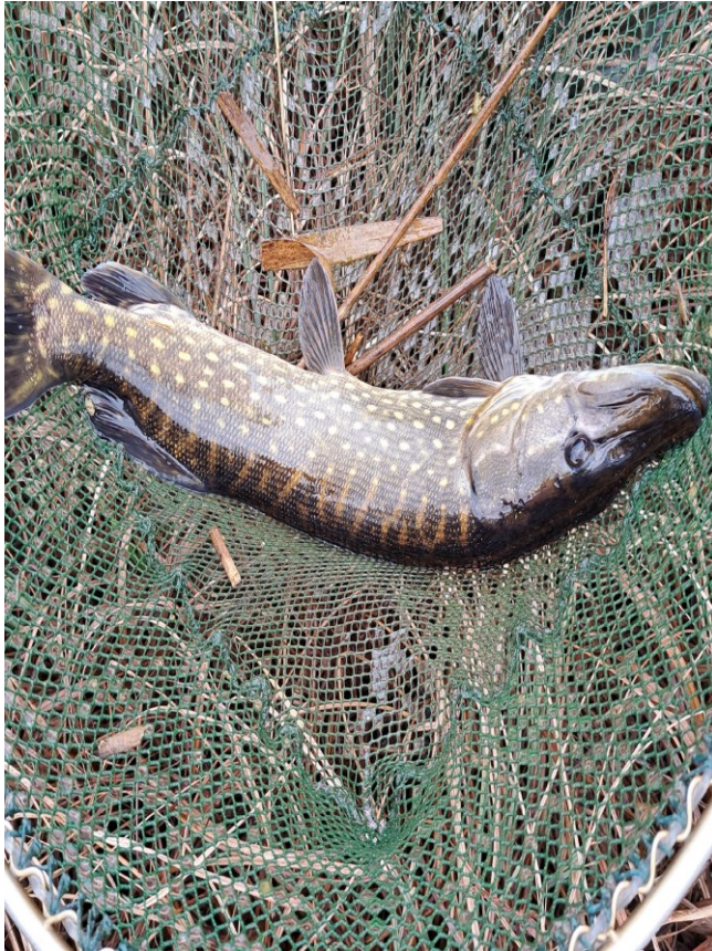
Hecht im Biotop Kiesgrube