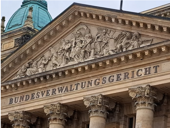
Bundesverwaltungsgericht, Leipzig