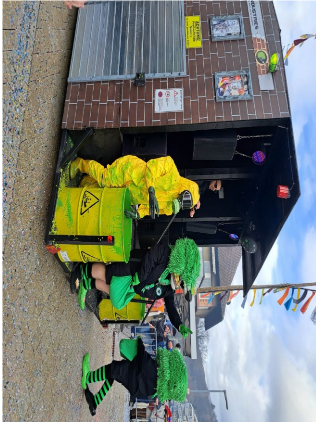
Umzug Grenzach-Wyhlen